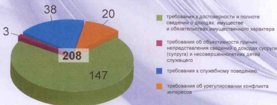
Рис. 2. Структура выявленных нарушений за 2013 год

Имеются в осуществлении деятельности комиссий и определенные трудности. Так, органы местного самоуправления сельских поселений в основном не имеют юридических структурных подразделений и подразделений кадровых служб, руководители которых должны входить в состав комиссий в обязательном порядке. Зачастую имеются случаи наделения полномочиями по решению кадровых вопросов должностных лиц общих и организационных отделов. Таким образом, практическая реализация мер по противодействию коррупции осуществляется лицами, которые выполняют функции кадровых сотрудников в качестве дополнительной нагрузки,